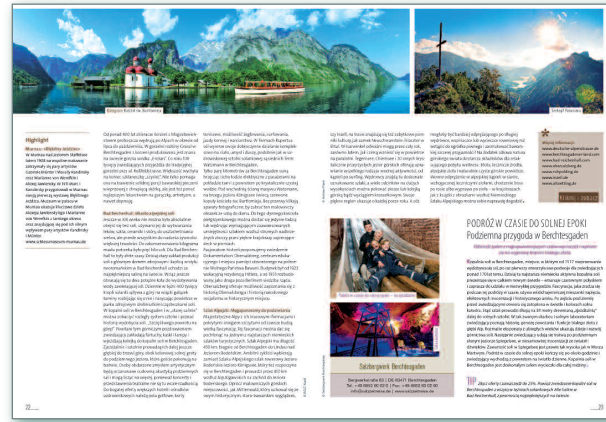
Marktspezifisches Inhaltsbeispiel Redaktionelles Feature Oberbayern